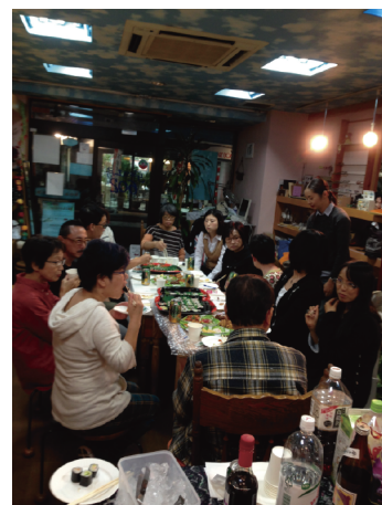
前回のイベント後の様子